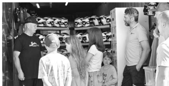
Pēc infrastruktūras uzlabojumu darbu pabeigšanas, trases lokus izmēģināt devās Smiltenes novada pašvaldības pārstāvji un SIA „ACBR”.

„Varbūt daudzi ārpus novada nezina, taču Smiltēnē ir lieliska kartingu trase un senas autosporta tradīcijas. Diemžēl laika gaitā trase bija nolietojusies, un pie mums vairs nenotika Latvijas čempionāta posmi. Pateicoties SIA „ACBR”