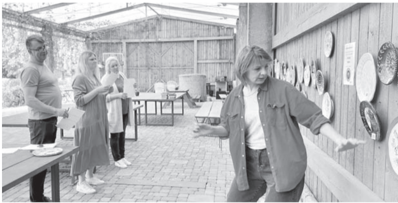
Konkursa žūrija ar aizrautību vērtē konkursam iesūtītos darbus.

Šogad konkursā piedalījās bērni un jaunieši piecās vecuma grupās no 24 dažādām Latvijas mākslas skolām un interešu izglītības iestādēm. Darbus vērtēja profesionālu keramiķu žūrija, īpašu uzmanību pievēršot tēmas atklāšanai, kompozīcijai, oriģinalitātei un tehniskajam