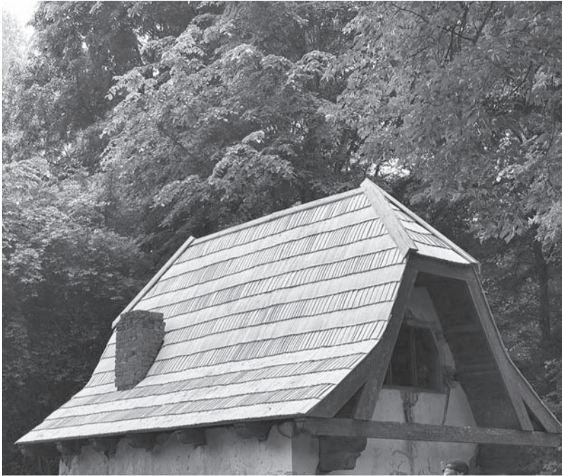
Vēsturiskā ēka ieguvusi jaunus vaibstus.