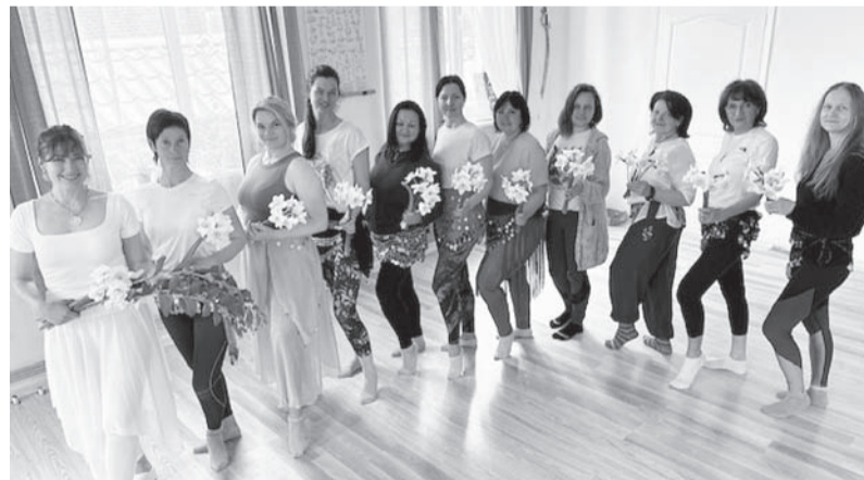
Smiltenes novada iedzīvotājiem bija iespēja pilnveidot izpratni par apzinātas kustības nozīmi ikdienā, uzlabot fizisko pašsajūtu un iegūt praktiskas iemaņas veselīga dzīvesveida veicināšanai.

Abi projekti izceļ mūžizglītības būtisko lomu vietējās