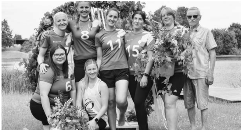
Smiltenes mamananet komanda.

2. līgā 1. vietu izcīnīja Alūksnes ķer un servē bumbu komanda, 2. vietā ierindojās Alojās „Ale Ma-