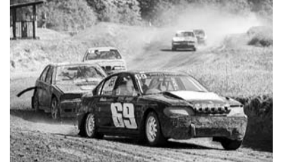
Smiltenes novada sportisti trasē.

No 2026. gada 27. līdz 28. jūnijam vienā no sarežģītākajām trasēm Latvijā – Priekules Līgo trasē – norisinājās Latvijas Autobiļu federācijas folkreisa vasaras kausa 3. posms. Sacensības uz starta stājās braucēji no visas Latvijas, tostarp arī mūsu novada censoni.