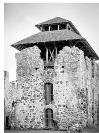
Raunas pilsdrupu tornis.

Madara Mūrniece-Krūmiņa, Komunikācijas un mārketinga speciāliste