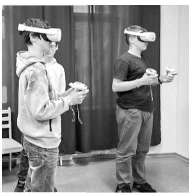
Smiltenes novada jaunieši apgūst virtuālās realitātes brilles izmantošanu.