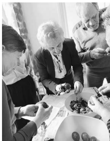
Seniori dalās savās Lieldienu svinēšanas tradīcijās un bauda satikšanās prieku.

Šobrīd īpaši aktīvi norisinās grupu nodarbības senioriem no 65 līdz 87 gadiem Virešu pagastā un Apes pilsētā, piedāvājot iespēju saturīgi un patīkami pavadīt laiku atbalstotā vidē. Tikšanās reizēs aplūkotas daudzveidīgas un senioriem saistošas tēmas. Dalībnieki dalījās savās atmiņās un pieredzē par tradīcijām, pārrunāja svētku svinēšanas nozīmi, īpaši pievērsties Lieldienu paražām. Tāpat tika akcentēta veselīga dzīvesveida nozīme – notikušas sarunas par sabalansētu uzturu un fizisko aktivitāšu nozīmi ikdienā. Īpašu interesi izraisīja nodarbības