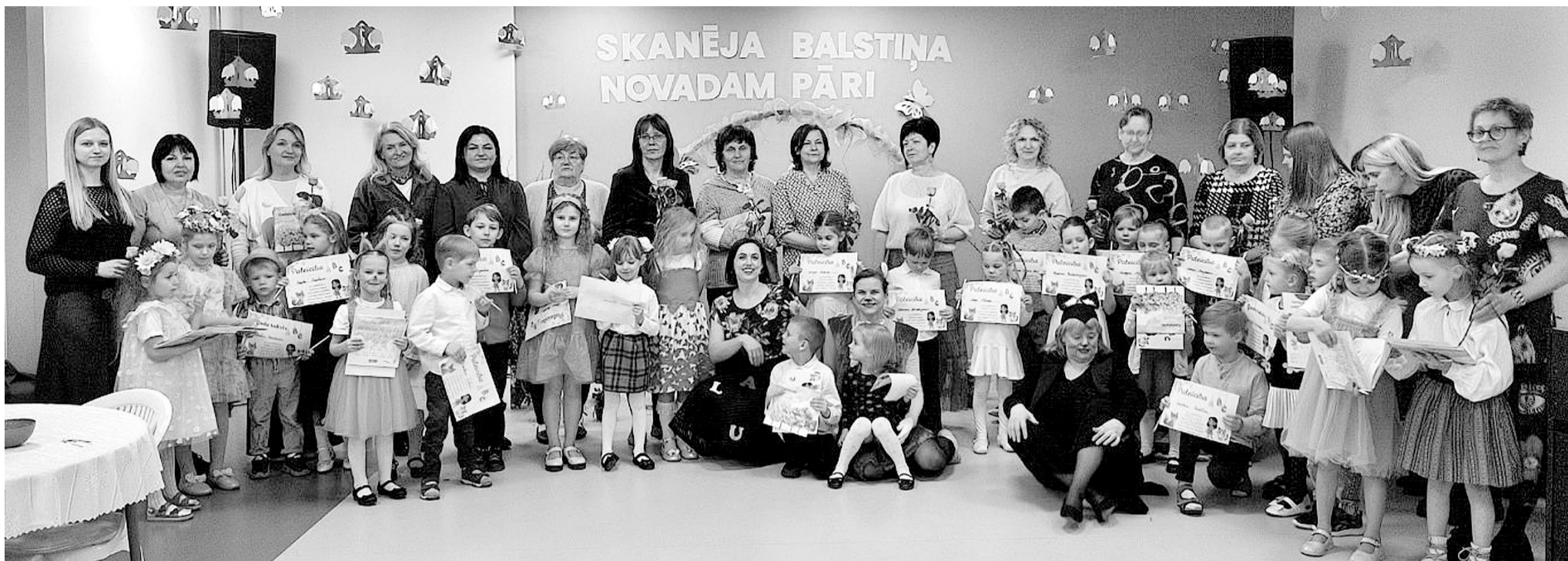
Smiltenes novada skatuviskākie pirmsskolas audzēkņi tikās Raunā, lai demonstrētu savu izteismību un artistiskumu.

Jau trešo gadu Raunas pagasts pulcēja pašus jaunākos runātājus uz sirsniņu un iedvesmojošu izteismīgās runas konkursu pirmsskolas vecuma bērniem. Pasākums kļuvis par skaistu tradīciju, kurā bērni ar prieku un aizrautību rāda savas prasmes un drosmi uzstāties auditorijas priekšā.