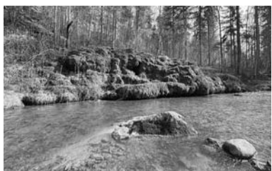
Raunas Staburags ir unikāls dabas veidojums.