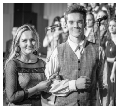
Lai visiem skolas nākamajiem absolventiem izdodas piepildīt savus skaistākos sapņus un cerības!

„Pēc tik emocionāliem un sirsnīgiem brīžiem kā šie, ko tikko piedzīvojām, jāatzīst: ja mums būtu vairāk šādu simtgades stāstu, mēs būtu ļoti bagāti,” klātesošos