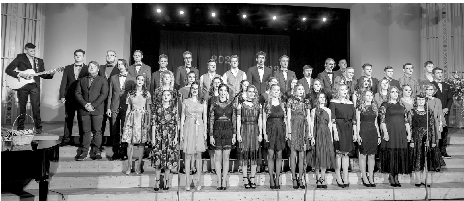
Nākamie absolventi Smiltenes vidusskolā piedzīvojuši daudz mirkļu, kurus lolos un atcerēsies visu mūžu.

12. klašu skolēni klātesošajiem ļāva iztēlēt atgriezties Smiltenes vecajā, leģendām apvītājā dzelzceļa stacijā, no kurienes daudzi smiltenieši devušies tālos ceļos, lai piepildītu lielus sapņus. Un, atrodoties ceļā jūtīs, skaudrāk nekā jebkur citur, apzinājušies, ka