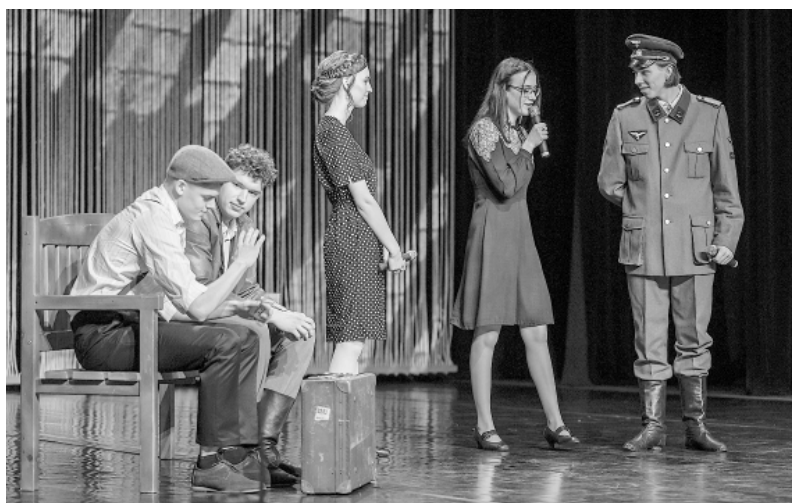
Jaunieši, saņemot piederības zīmi Smiltenes vidusskolai, kavējās savās un Smiltenes simtgades laika izjūtās.